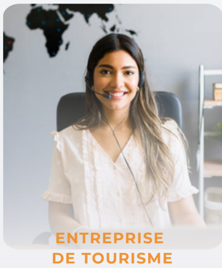
ENTREPRISE DE TOURISME

Les métiers visés sont très diversifiés et les titulaires du BTS tourisme disposent ainsi d'un large choix de débouchés. Les employeurs potentiels peuvent être classés en quatre groupes :