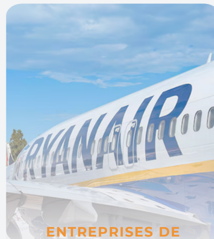
ENTREPRISES DE TRANSPORT

Les organismes de tourisme territoriaux incluent les offices de tourisme, les comités de tourisme, les parcs naturels, les sociétés d'économie mixte et les associations de développement patrimonial ou touristique (écomusées, routes touristiques,...).