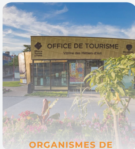
ORGANISMES DE TOURISME TERRITORIAUX

Les entreprises de tourisme incluent les agences de voyages (réceptives et distributrices), les tours opérateurs, les plateaux d'affaires, les centrales de réservation, les structures associatives, les bureaux d'escale de croisiéristes, les parcs d'attraction, les loueurs de véhicules et les vendeurs de coffrets cadeaux.